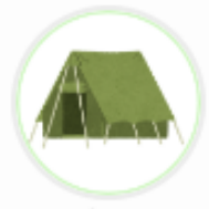
アウトドアショップ (兵庫県)