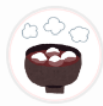
都松庵枚方T- SITE (大阪府)

自店の利用者分析レポート (Vポイントレポート) を確認すること で、商圈や客層、販促効果の調査や確認が行えるため。