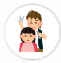
BPJ目黒 (東京 都)

Vポイントを導入することで 店舗のサービス向上と顧客満足度UPに繋がられ、 お客様に喜んでいただけたため。