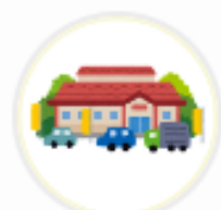
ママンマルシェ TAKANABE (宮崎県)

ポイントを利用する機会がなかったことで、 ポイントを利用できてるお店が分かって嬉しい。