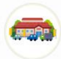
ママンマルシェ TAKANABE (宮崎県)

Vポイントカードの提示をご案内することで、お客様へのVポイント利用の機会を増やしています。