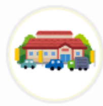
ママンマルシェ TAKANABE (宮崎県)

(店舗の所在地である) 枚方市は、 Vポイントカードの所持率が高いと聞き、 多くの方に使っていただけたため。