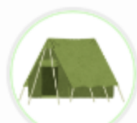
アウトドアショッ プ (兵庫県)

Vポイントを利用していただくことで、 お客様にお得にお買い物を楽しんでいただき、 少しでも自店の購入点数を増やしてもらいたいため。