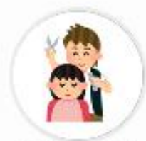
BPI Jibun (東京都)

Vポイントをご利用いただいたお客様へ、感謝の意を込めてVポイント付与の倍率を高くするなどの工夫を行っています。