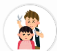
BPI*目黒 (東京 都)

貯めていただいたVポイントを利用していただくことで、 お客様にお得感を感じていただきたいため。