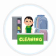
黒川クリーニング (福井県)

Q5. (最後に) 2024年4月22日に旧名称TポイントはSMBCグループのVポイントと統合し「青と黄色のVポイント」に生まれ変わりました!