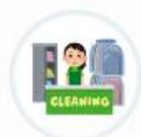
黒川クリーニング (福井県)

お客様にはVポイントをご利用いただきお得感を感じていただくために、黒川クリーニング社 全店でご利用促進を取り組んでおります。