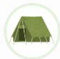
アウトドアショップ (兵庫県)

Vポイントをご利用いただいたお客様へ、感謝の意を込めてVポイント付与の倍率を高くするなどの工夫を行っています。