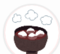
都松庵枚方T- SITE (大阪府)

Vポイントを利用していただくことで、 お客様にお得にお買い物を楽しんでいただき、 少しでも自店の購入点数を増やしてもらいたいため。