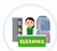
黒川クリーニング (福井県)

貯めていただいたVポイントを利用していただくことで、 お客様にお得感を感じていただきたいため。