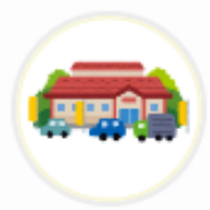
ママンマルシェ TAKANABE (宮崎県)