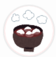
都松廣枚方T-SITE (大阪府)