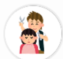
BPI Jijū (東京都)

Vポイントをお店で利用できること、使い方を知らない方がまだまだいらっしゃいます。 しっかり店頭での告知を行うことが大切です。