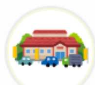
ママンマルシェ TAKANABE (宮崎県)

お会計時にVポイントが使えることをしっかりお客様にお伝え することで、お客様に損がないようなご案内を心がけるため。